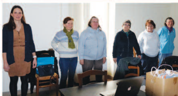
Cours du numérique du 3 Mars