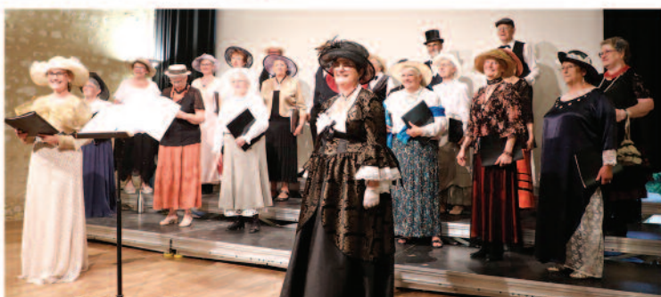
Chorale entre Vienne et Creuse du 9 Juin