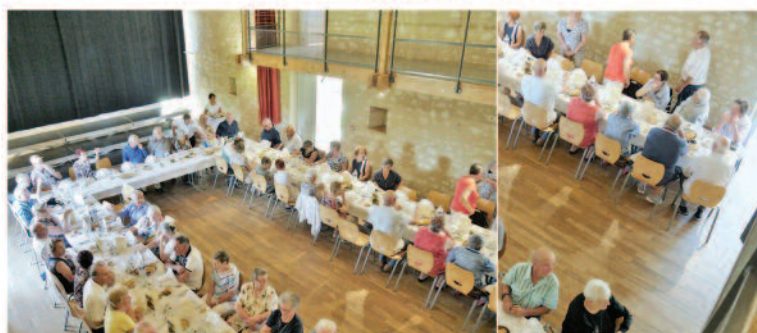
Repas des 70 ans du 8 Juin