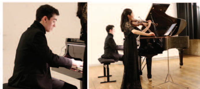
Concert du 21 Février au Pôle Culturel