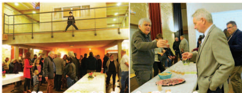
Vœux du Maire du 5 Janvier